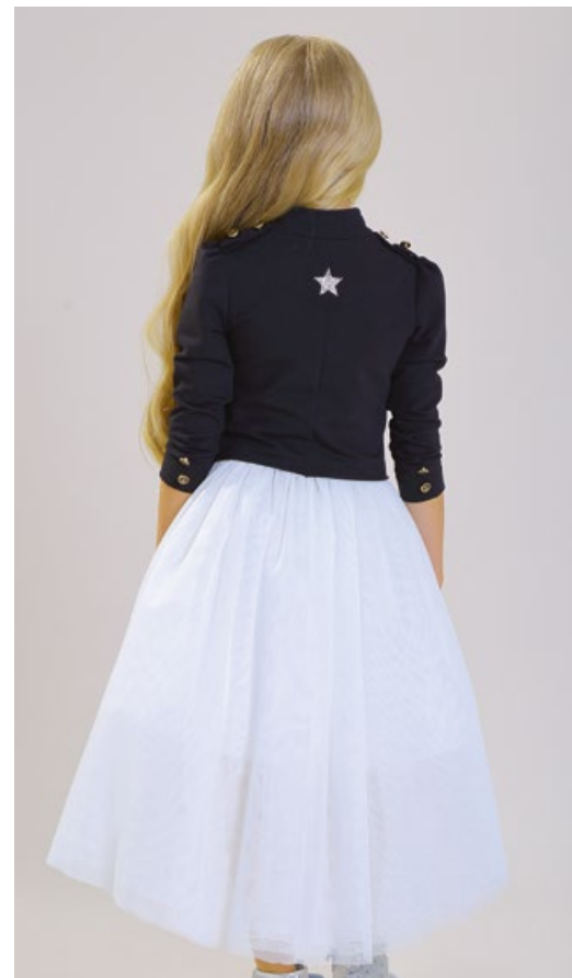
Платье и жакет (комплект) 1776-118-СП