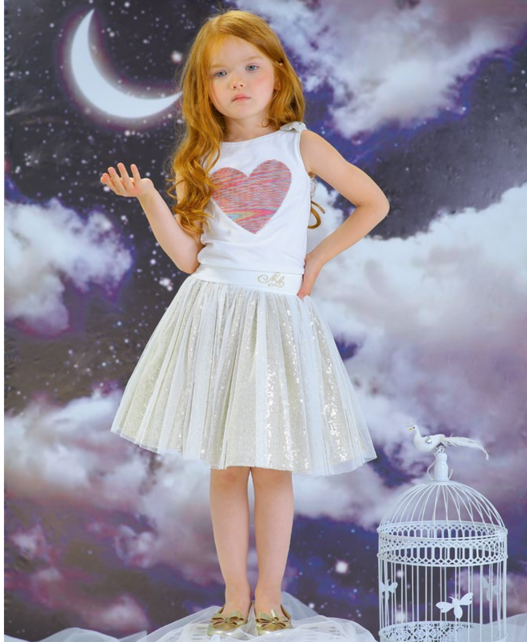
Блузка и Юбка 1713-118-ТХК-180