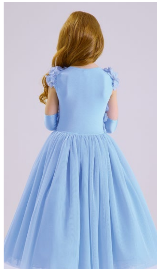
Платье 1829-118-ТХК - 180