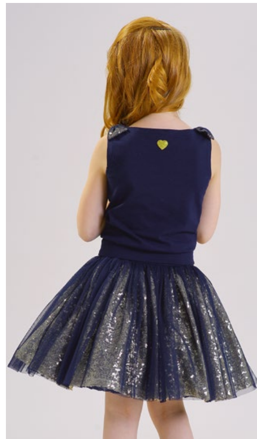
Блузка и Юбка 1713-118-ТХК-180