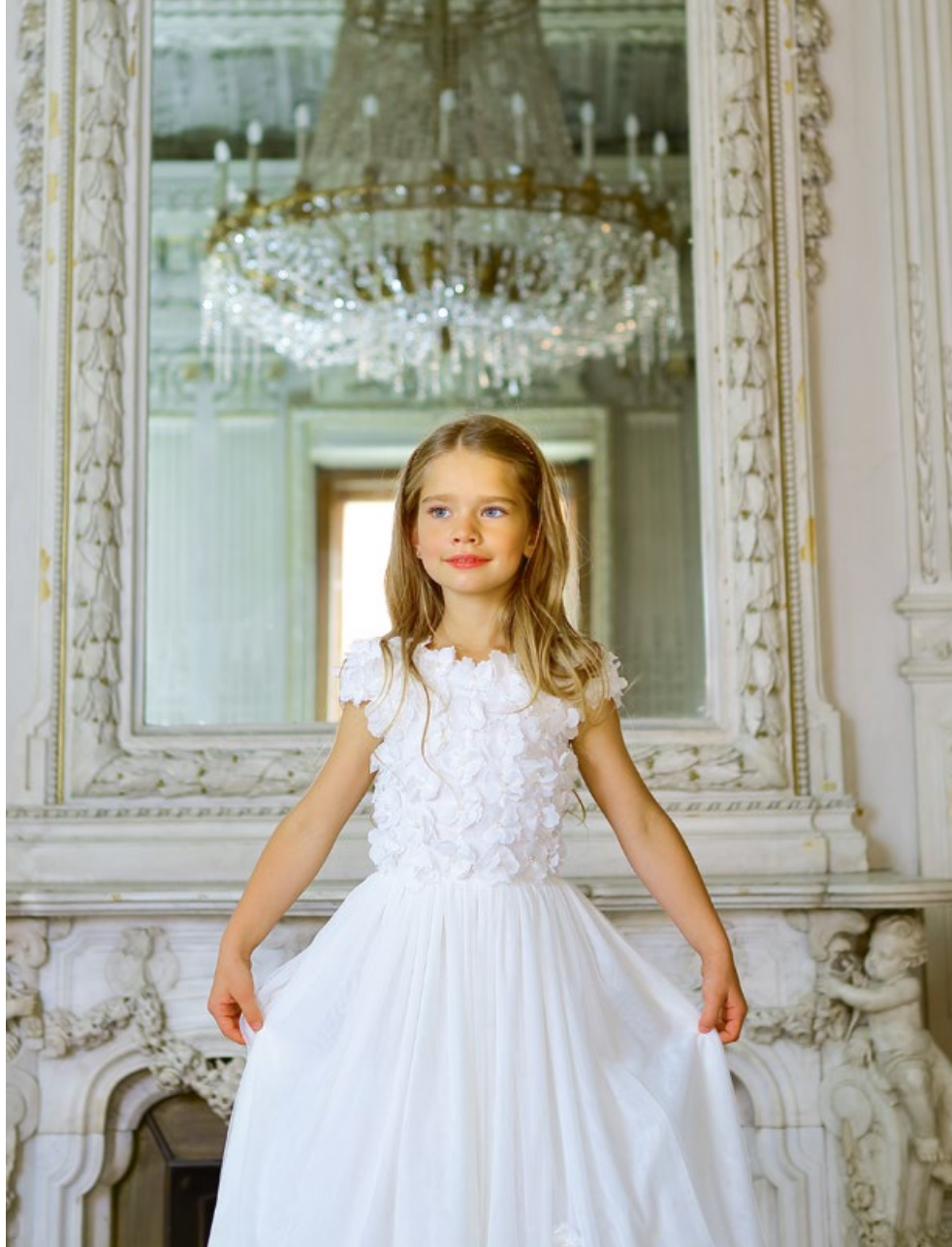
Платъе 1829-118-ТХК - 180