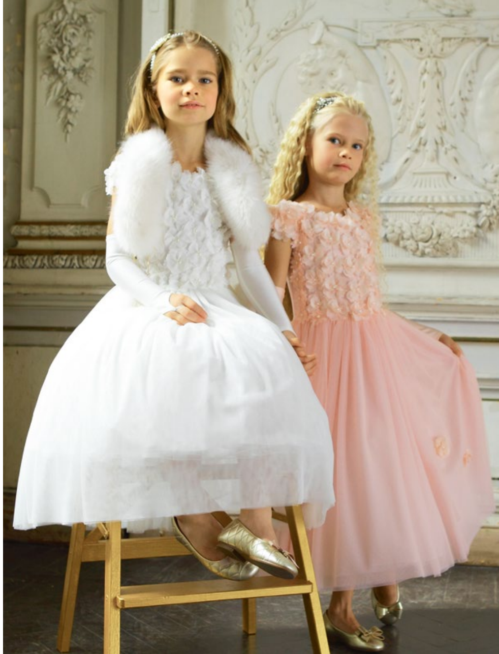
Платье 1829-118-ТХК - 180