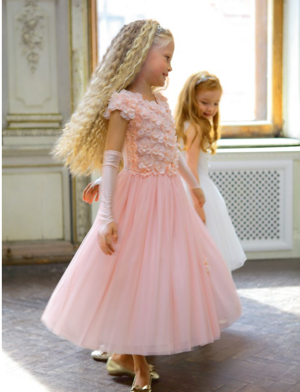
Платъе 1829-118-ТХК - 180