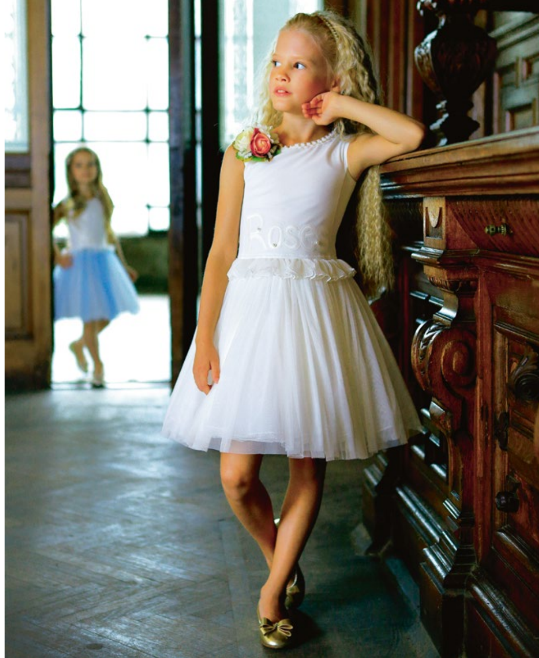
Платье 1832-118- ТХК-180