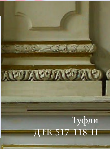
Туфли ДТК 517-118-Н