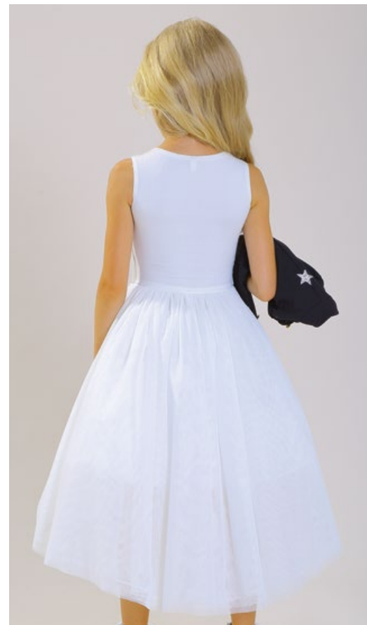
Платье и жакет (комплект) 1776-118-СП