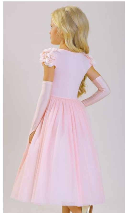
Платъе 1829-118-ТХК - 180