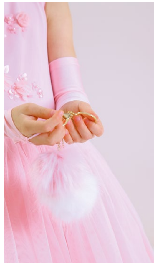
Подвеска двойная 213/1-118-ВМ