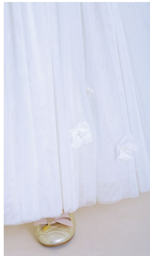
Платъе 1829-118-ТХК - 180