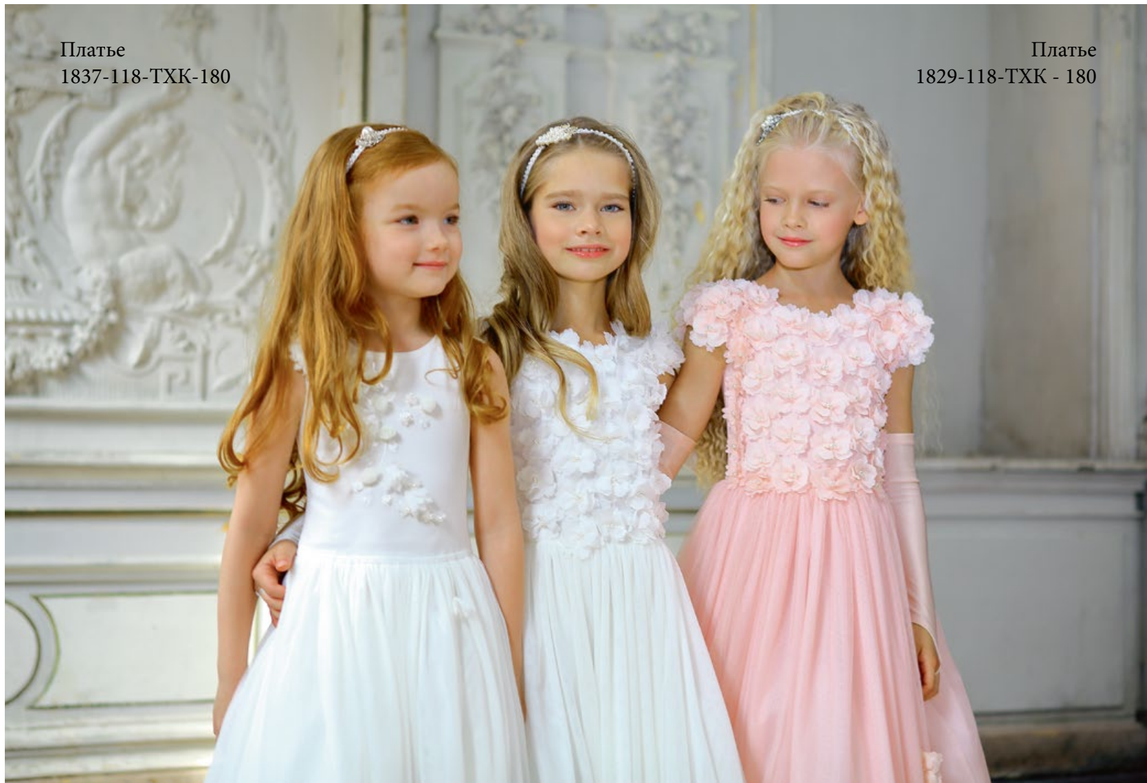
Платъе 1829-118-ТХК - 180