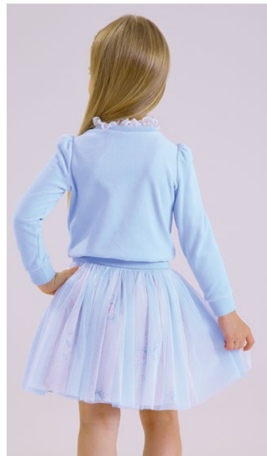
Джемпер 1809/1-118-ТХВ Юбка 1817-118-ВХА-Н